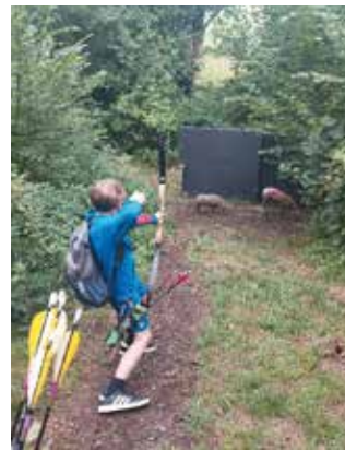
voller Einsatz beim Bogenschießen