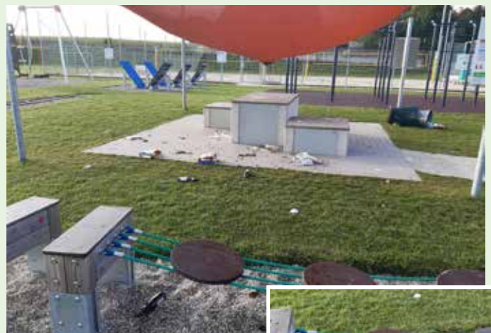
Verwüstungen beim Motorikpark