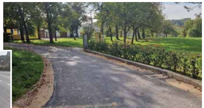
Generalsanierung in Oberautal