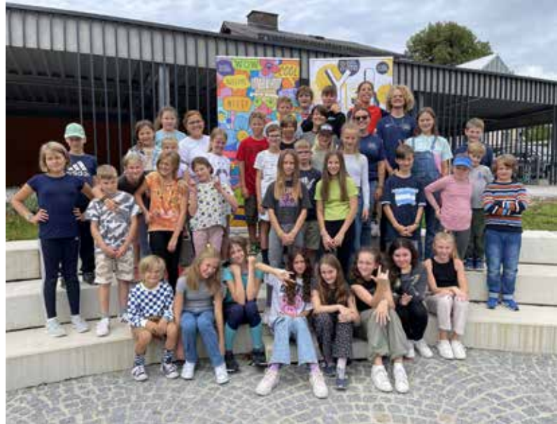
Viel Spaß und Action beim Englisch-Camp

Heuer haben die Eltern von insgesamt 41 Kindern im Alter von 3 bis 10 Jahren dieses Angebot genutzt und konnten so bei der Betreuung ihrer Kinder während der Sommerferien unterstützt werden.