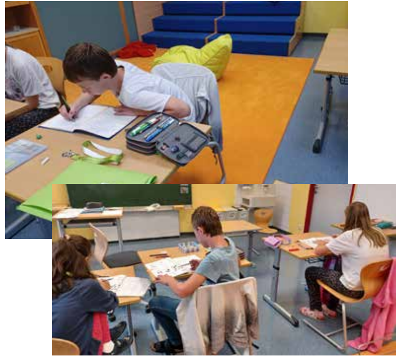
Unterricht in der Koop-Klasse