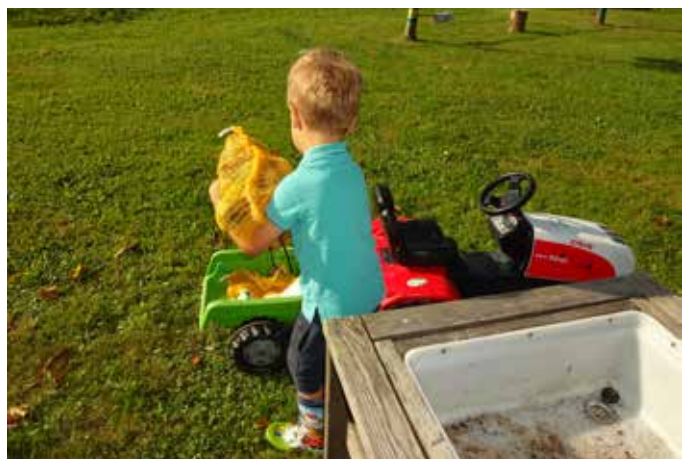
Die geernteten Kartoffel werden auf den Anhänger verladen.