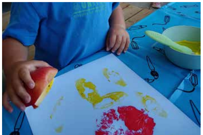
Stempeln mit Obst