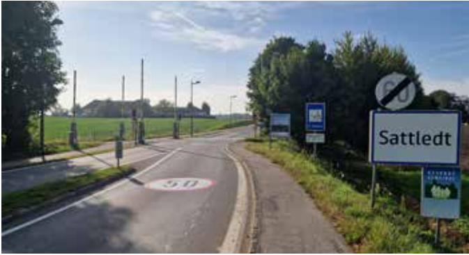
B122: Sicherheit durch 50er