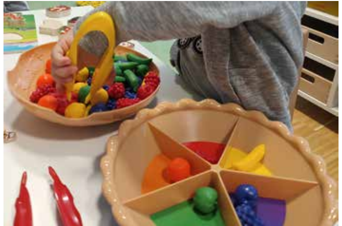
Mit der Zunge nach Farben sortieren.