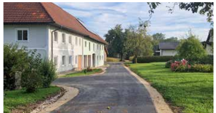
Straßensanierungen in der Oberen Zeile