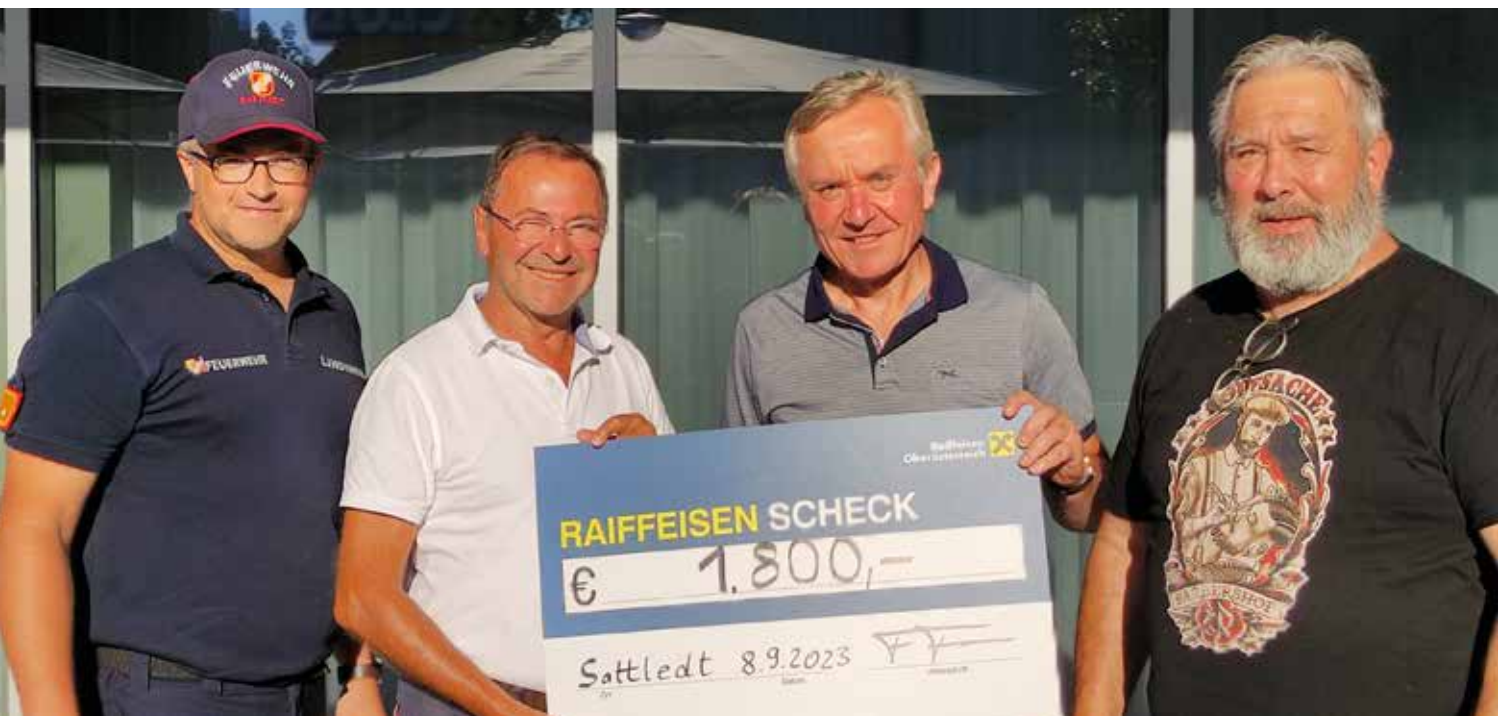
Unterstützende Betriebe des Wirtschaftsstammtisches:

Ackerl, Buchner, Strasser, Wurzelwerk, Frigologo, Funk Fuchs, Bamminger, Orthotechnik Falkensammer, Felbermayr, Sparkasse, ontime logistics, Kienbauer, Geodata, Dietachmair, Kirchmayr, Lachmayr, Stewa, Raiffeisenbank, Übleis, Hunger, Fronius, DDr. Thaler, Vorwerk