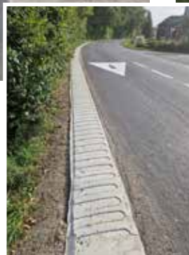
rechts: Sanierung Gewerbestraße