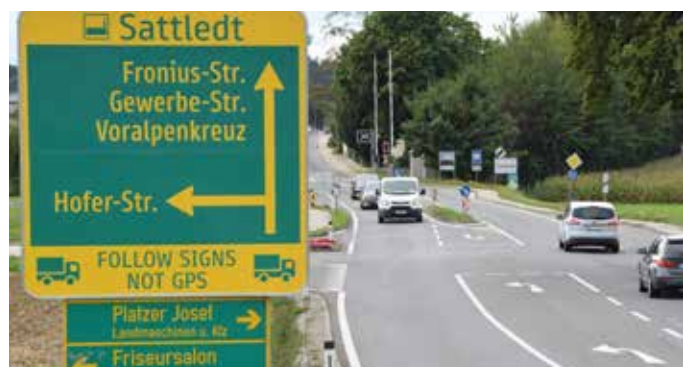
Das neue Leitsystem, zu sehen die Tafel von Kremsmünster kommend.