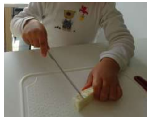
Die Kinder dürfen bei den Vorbereitungen mithelfen.