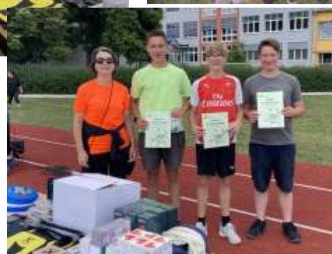
Gewinner der 4. Klassen