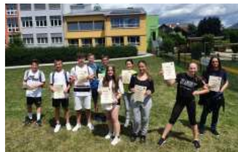
Das Siegerteam des Sporttages