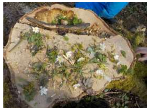
Ein Mandala aus Waldschätzen