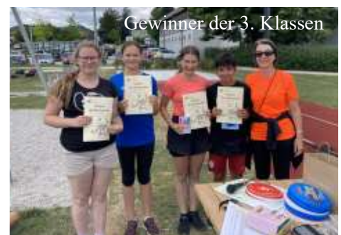
Gewinner der 3. Klassen