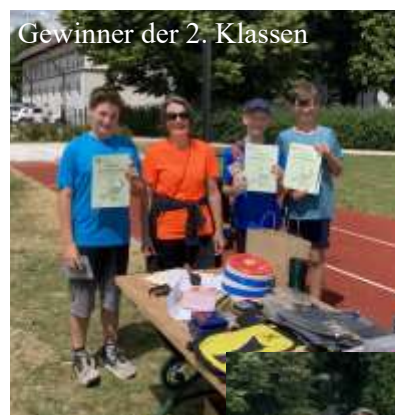
Gewinner der 2. Klassen