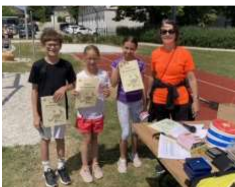
Gewinner der 1. Klassen

Mathematik ist mehr als Rechnen. Es geht ums Selbstüberlegen, um das Erkennen von Strukturen und Zusammenhängen, um Eleganz statt nur um „Schema F“.