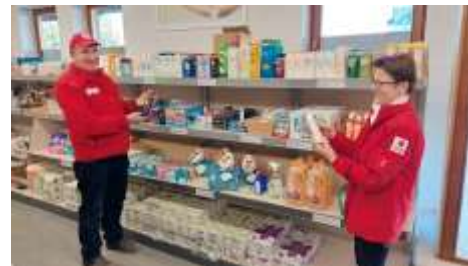
Freiwillige Mitarbeiter im Rotkreuz-Markt Kremsmünster.

Sie sollten freundlich, verlässlich, verschwiegen und teamfähig sein, von Vorteil wäre auch der B-Führerschein.