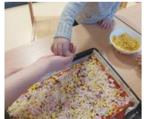
Lernen geschieht durch Üben und Wiederholen.